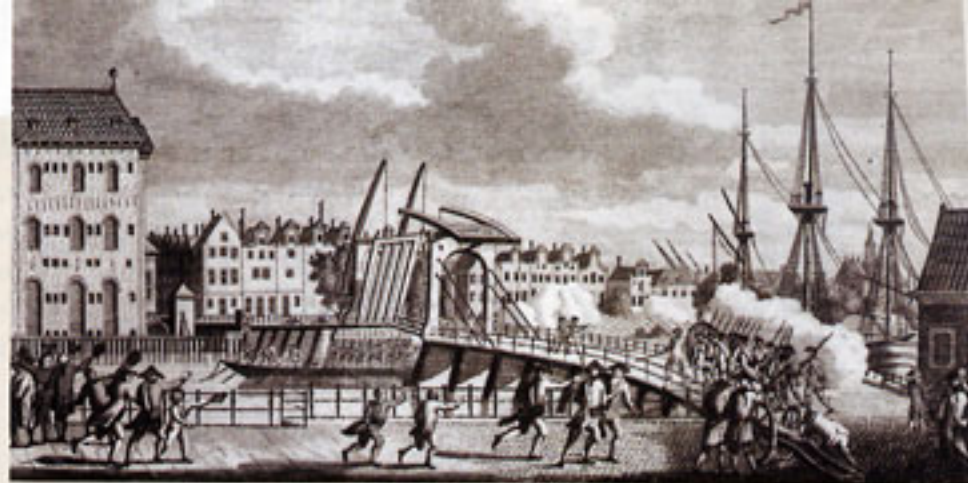
De brug naar Kattenburg (met links het huidige Scheepvaartmuseum), tijdens rellen tussen orangisten en patriotten op 30 mei 1787. De Kattenburgers waren nagenoeg zonder uitzondering Oranjegezind en de buurt was dus een logisch doelwit voor rebellerende patriotten.