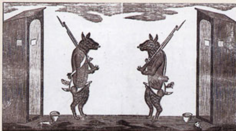
Politieke prent uit 1787 waarin de patriotten belachelijk worden gemaakt. Twee keeshonden – naar de Dordtse Cornelis (Kees) de Gijsselaar werden patriotten spottend kees genoemd – bewaken hun post, maar de Oranjeklanten vrezden geen gevaar.

De KEESSEN aan Wapen en Posten tussen Amsterdam 1787.